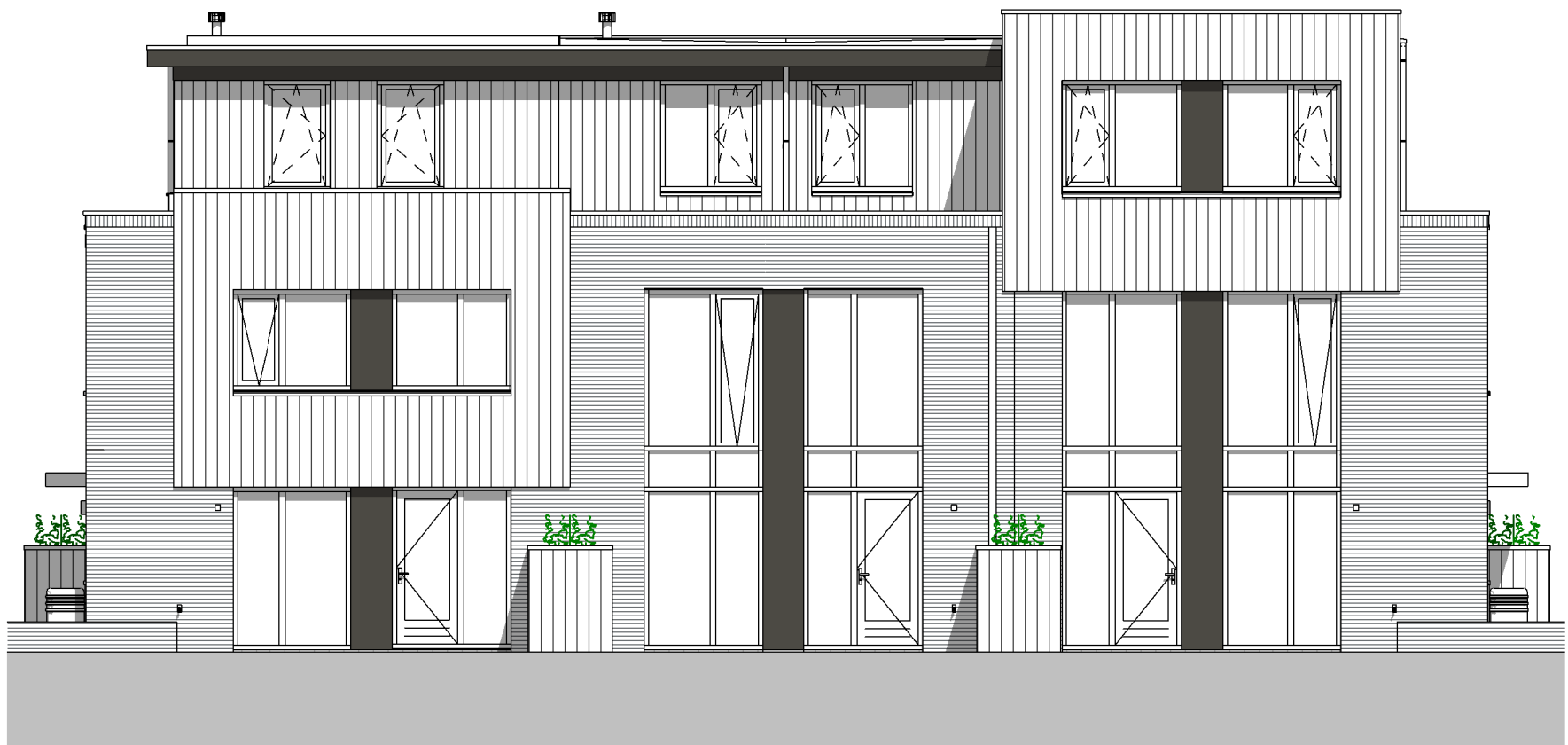
Achtergevel 1 : 100

Bouwnummers 03, 06, 12, 15, 21 en 24 krijgen bij de optie vide geen aanpassing in de achtergevel i.v.m. bestaande gevelindeling